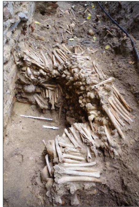
Figuur 3. Zicht op de muurtjes opgebouwd uit lange beenderen

Labo-analyses hebben aangetoond dat het botmateriaal waaruit de knekelmuurtjes opgebouwd zijn, hoofdzakelijk dateert uit de tweede helft van de 15de eeuw. Op basis van het aardewerk dat geassocieerd is met de knekelmuurtjes wordt momenteel aangenomen dat het om een ruiming gaat uit de 17de of de eerste helft van de 18de eeuw, die niet in de bronnen vermeld wordt. Deze hypothese moet nog bevestigd worden door verder onderzoek.