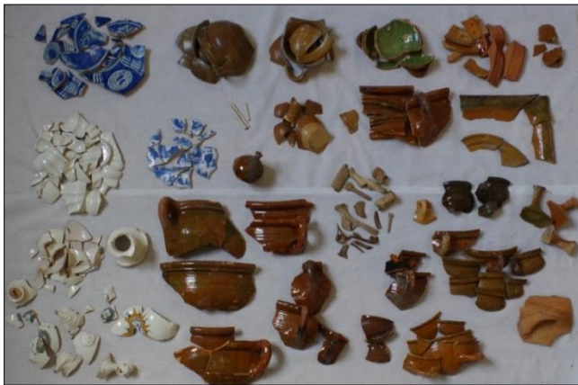
Figuur 4. Selectie van het aardewerk uit de beerput