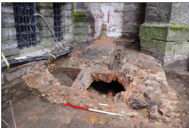
Figuur 2. Beerput met bakstenen gewelf