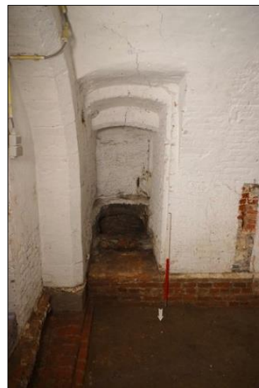
Figuur 3. Latrine in de zuidmuur van de oude sacristie